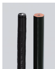
↑鉛筆より細い内視鏡